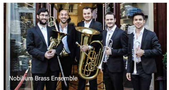
Nobilium Brass Ensemble